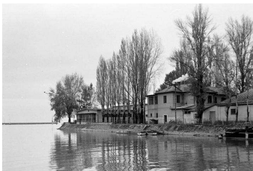
Régi yacht klub